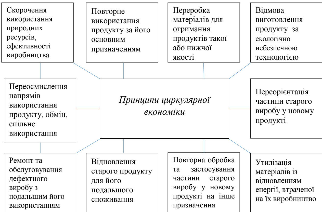
Рисунок 1. – Принципи циркулярної економіки