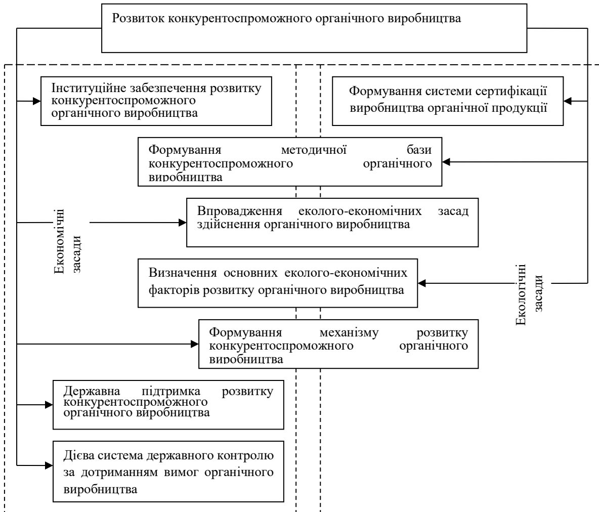
Рис. 2. Еколого-економічні засади розвитку конкурентоспроможного органічного виробництва

Джерело: складено автором на основі [4; 5; 6]