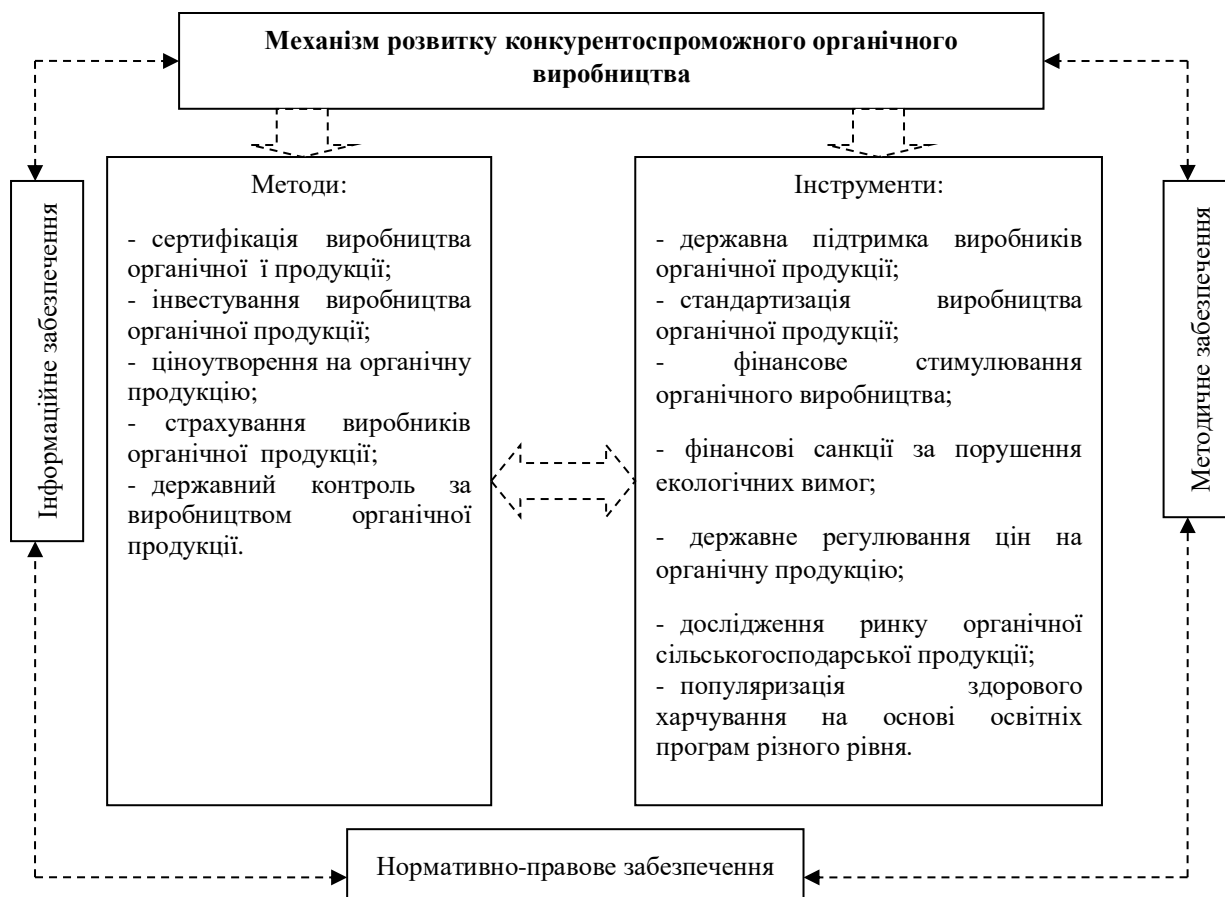
Рис. 3. Формування механізму розвитку конкурентоспроможного органічного виробництва

проектів підтримки виробників, які включають в себе надання фінансової, технічної, консультативної допомоги); створення відповідного інфраструктурного забезпечення; вертикальної інтеграції; маркетингову концепцію розвитку.