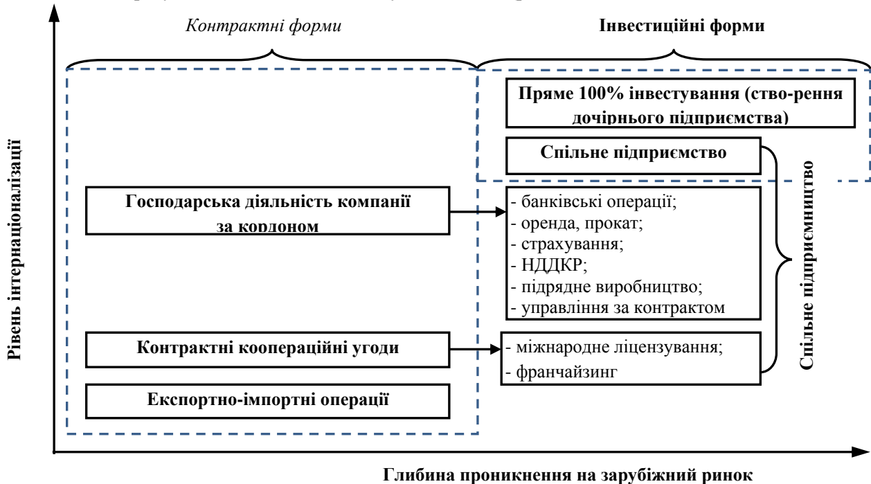
Рис. 1. Форми міжнародного бізнесу*

В процесі виходу на іноземні ринки підприємство проходить різні ступені інтернаціоналізації та участі у міжнародному бізнесі, зокрема виділяють контрактні та інвестиційні форми такої участі. Ці форми міжнародного бізнесу для розуміння рівня їх інтернаціоналізації та глибини проникнення на зарубіжний ринок можна згрупувати наступним чином (рис. 1).