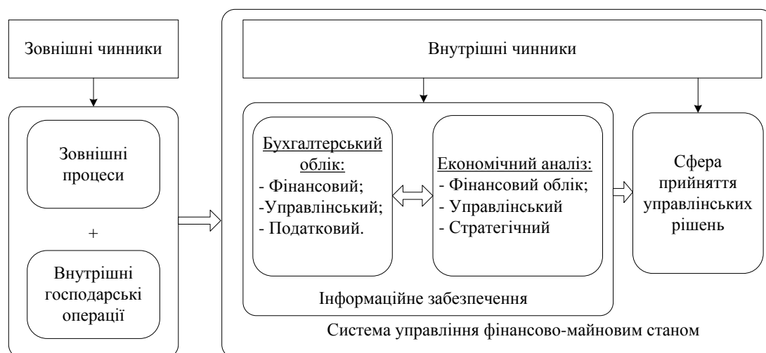
Рис. 1 Складові системи інформаційного забезпечення управління фінансово-майновим станом підприємства*

Такий підхід до питання елементів інформаційного забезпечення в рамках системи управління фінансово-майновим станом підприємства вимагає проведення окремого дослідження етапів формування (рис. 1).