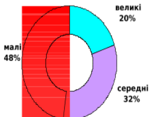
Рис. 2. Структура зайнятості за підприємствами [6]

Отже, аналізуючи середню кількість працюючих на підприємствах відносно законодавчих критеріїв визначення категорій суб'єктів підприємництва, можна зазначити, що вирішальним стимулом розвитку малого підприємництва є спрощена система оподаткування. Разом з тим відсутність інших механізмів державної підтримки і необхідність власників малих підприємств сплачувати ЄСВ за своїх працівників обмежує прагнення підприємств до зростання кількості їх найманих працівників до граничних меж, а також сприяє розвитку тіньового сектору. Частка виробленої продукції підприємствами представлена на рис. 3.