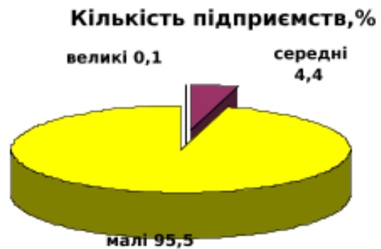
Рис. 1. Структура підприємств за розмірами в Україні [6]

На кінець 2015 року в Україні налічувалось 1973 тис. суб'єктів малого і середнього підприємництва (проти 1932 тис. в попередньому році), з яких 1,63 млн фізичних осіб-підприємців і 343 тис. юридичних осіб-підприємців. Структура підприємств за розмірами представлена на рисунку 1.