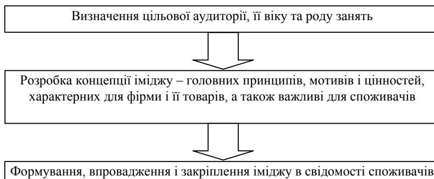
Рис.1 Основні етапи формування іміджу підприємства [4]

«належить» фірмі – у вигляді візуальної атрибутики фірмового стилю, інша його частина створюється засобами публік релейшнз і живе в масовій свідомості споживача. Якщо фірма не подбає про створення потрібного іміджу, споживачі можуть обійтися власною уявою і прийти до власного варіанту іміджу, який не завжди буде виграшним для фірми. На рис.1 представлені основні етапи формування іміджу.