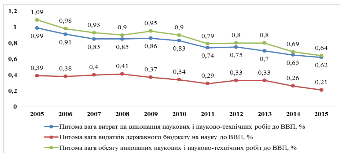
Рис. 2. Динаміка питомих ваг витрат на виконання наукових і науково-технічних робіт, питомих ваг видатків державного бюджету на науку, питомих ваг обсягу виконаних наукових і науково-технічних робіт у ВВП за 2005 – 2015 роки, % [2; 9-15]

На основі показників, відображених на рис. 2, в Україні спостерігається погіршення основного індикатора розвитку наукової сфери – показника наукоємності ВВП (частки витрат на виконання наукових досліджень та розробок у ВВП), який з 2005 по 2015 роки зменшився з 0,99% до 0,62 % (на 0,37 в.п.) відповідно і тим самим вплинув на зміну економічної функції науки на пізнавальну. Це свідчить про зниження уваги з боку держави до наукової та науково-технічної роботи. На