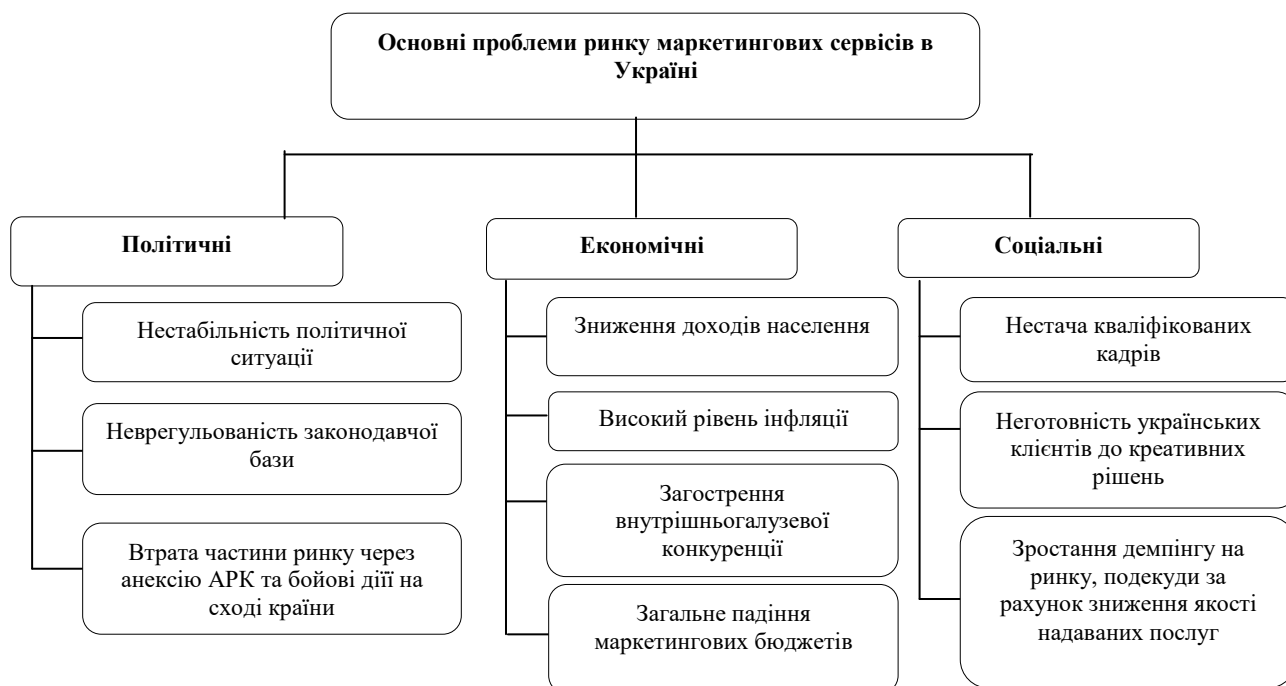
Рис. 3 Основні проблеми ринку маркетингових сервісів в Україні*

Однак за оцінками різних спеціалістів, для українського ринку маркетингових сервісів характерна низка проблем, а саме (рис.3):