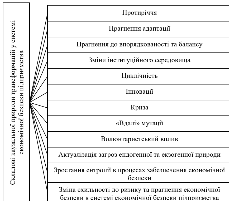
Рис. 1 . Складові каузальної природи трансформацій в системі економічної безпеки підприємства [8-14, 19, 20]

Дослідження каузального характеру трансформацій у системі економічної безпеки підприємства спирається на причини змін у загальному розумінні (трансформація за своїм характером є зміною, і тому на неї поширюються загальні закономірності проходження змін), природу економічної безпеки як соціального та економічного феномену, а також на закономірності функціонування та розвитку систем різної природи. Монографічний аналіз [8-14, 19, 20] дозволяє виділити такі складові каузальної природи трансформацій у системі економічної безпеки підприємства (рис. 1)