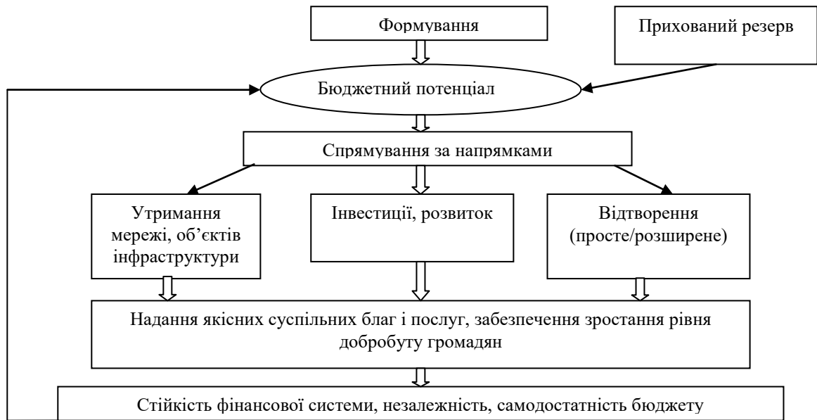
Рис.3. Схема формування та використання бюджетного потенціалу*

наявні «резерви», в тому числі з різних причин приховані.