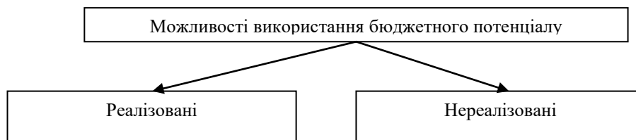
Рис.2. Розподіл використаного бюджетного потенціалу за одержаними результатами*

Таким чином, виходячи з сучасних реалій, необхідно при оцінці використання бюджетного потенціалу розподіляти його на дві складові: реалізовані та «нереалізовані можливості» (рис.2). Що це дає? По-перше, об'єктивно оцінити ефективність та результативність бюджетного потенціалу при його використанні. По-друге, відображаючи «нереалізовані можливості», наприклад через ЗМІ, Internet, стимулювати розпорядників коштів до ефективного використання бюджетного потенціалу та недопущення подібних випадків у майбутньому. По-третє, відкрито заявляючи про проблеми у бюджетній сфері, держава стимулюватиме інституційні зміни в суспільстві. Наприклад, залучення широкої громадськості до обговорення болючих бюджетних проблем сприятиме ліквідації недовіри суспільства до влади, формування незалежного інституту громадського контролю та його активної участі у бюджетному процесі, що позитивно вплине на якість бюджетного процесу і використання бюджетного потенціалу.