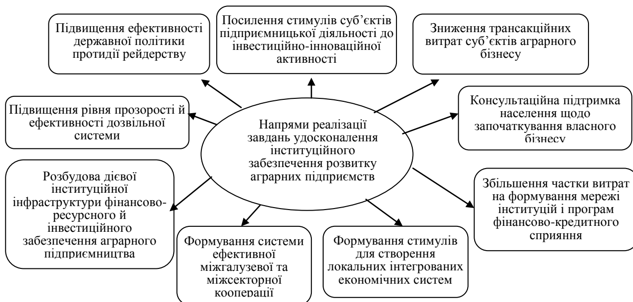
Рис. 2. Напрями реалізації завдань удосконалення інституційного забезпечення розвитку аграрних підприємств*

діяльності, підтримка саморегульованості і конкурентності у ринковому середовищі (табл. 2) [9, с. 44]. Основні напрями реалізації завдань удосконалення інституційного забезпечення розвитку аграрних підприємств представлені в узагальненому вигляді на рис. 2.