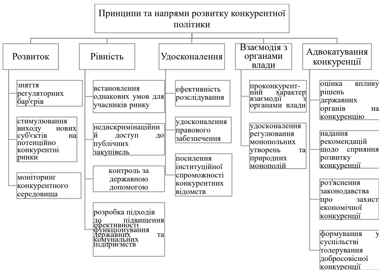
Рис. 1. Принципи та напрями розвитку конкурентної політики*

Антимонопольний комітет України (АМКУ) є державним органом зі спеціальним статусом, діяльність якого спрямована на забезпечення державного захисту конкуренції у підприємницькій діяльності та у публічних закупівлях. Змістовна характеристика особливого статусу Антимонопольного комітету України визначається його завданнями та повноваженнями, включаючи його роль у розробці конкурентної політики, та визначається законами, іншими нормативно-правовими актами та, зокрема, й спеціальною процедурою призначення та звільнення голови, заступників та державних уповноважених, голів територіальних відділень, наданні захисту майнових прав працівників в умовах оплати праці [19].